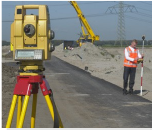
ALT YAPI UYGULAMALARI