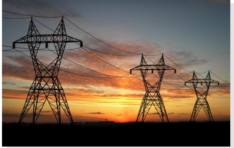
ENERJİ İLETİM HATTI