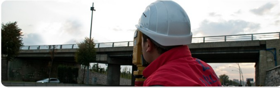
KÖPRÜ DEFORMASYON TAKİBİ